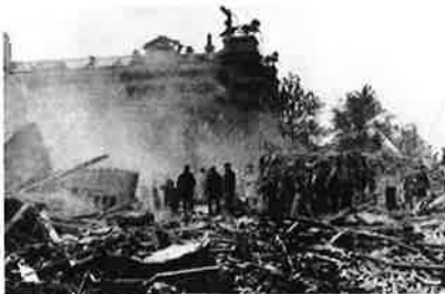
V – bommen in Antwerpen